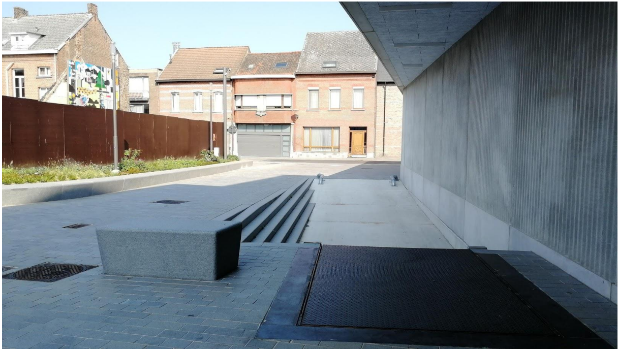
Loskade cc Binder (Begijnhofstraat 24 , 2870 Puurs-Sint-Amands)