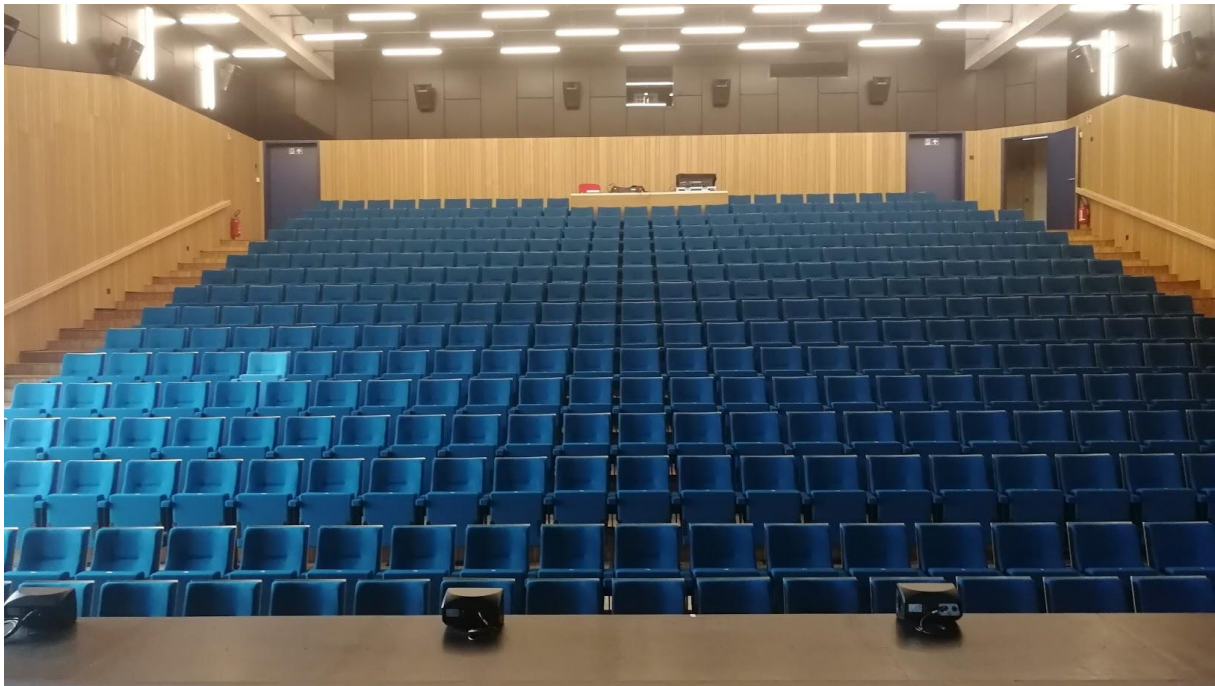
Zaal Kollebloem - cc Binder