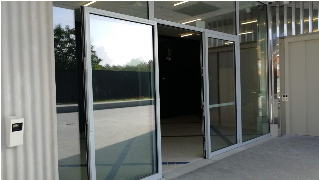
Artiesteningang loskade